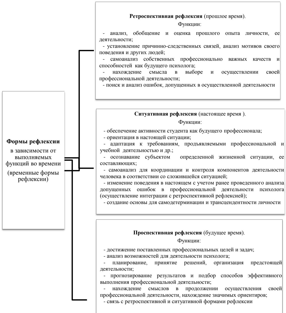
Рисунок 1. – Формы рефлексии – ретроспективная, ситуативная и проспективная

профессионального опыта необходимы для обеспечения профессиональной успешности студентов-психологов. Наделение смыслами во всех временных периодах своей профессиональной деятельности является значимым аспектом в становлении практических психологов.